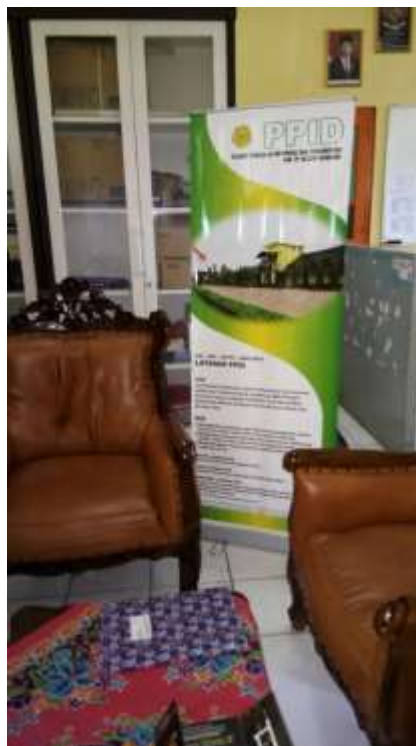
Gambar 2. Ruang Tunggu layanan informasi public

Selain sarana dan prasarana diatas untuk memenuhi kebutuhan akan informasi dan meningkatkan pelayanan keterbukaan informasi kepada