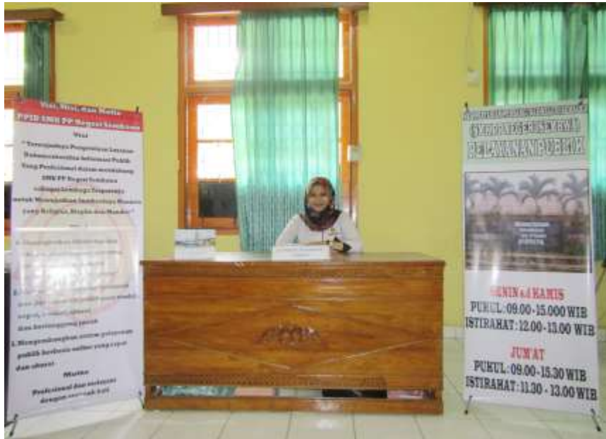
Gambar 1. Meja Layanan Informasi Publik