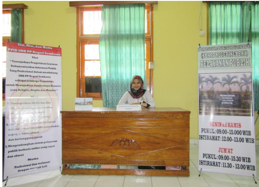
Gambar 1. Meja Layanan Informasi Publik

Selain sarana dan prasarana diatas untuk memenuhi kebutuhan akan informasi dan meningkatkan pelayanan keterbukaan informasi kepada masyarakat, SMK-PP Negeri Sembawa berusaha melakukan pengembangan dalam penyediaan informasi public melalui: